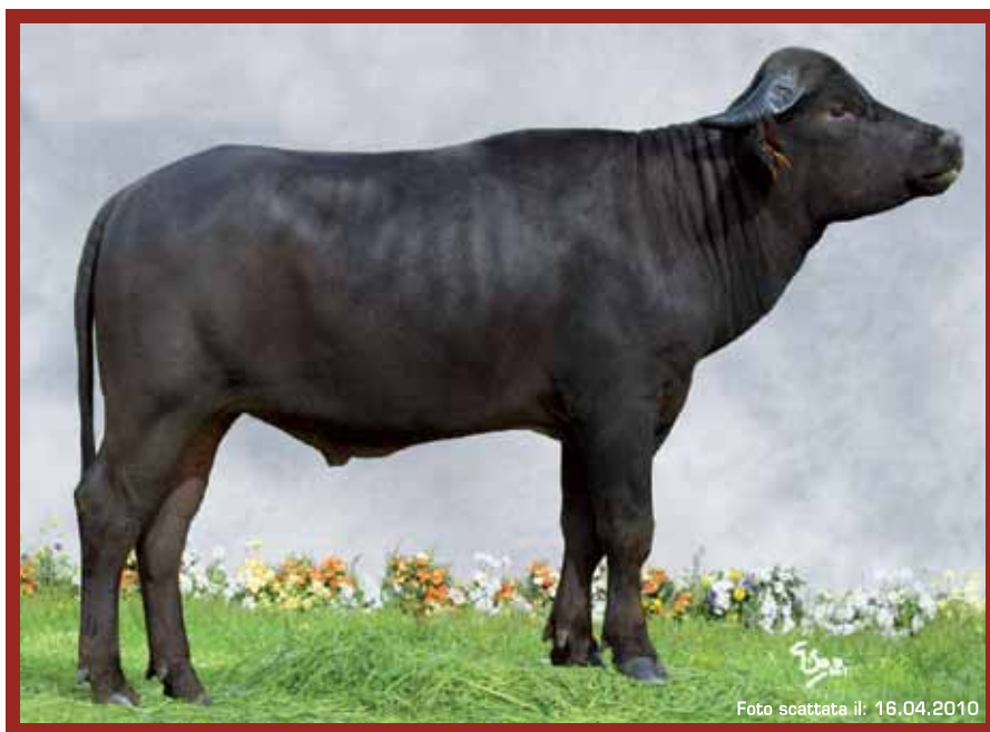
Foto scattata il: 16.04.2010